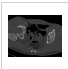
CT dorzokraniální luxace pravé kyčle