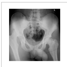
RTG dorzokraniální luxace pravé kyčle