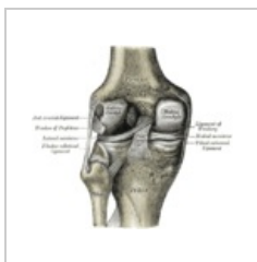
Kolenní kloub (pohled zepředu)

Kostěné spojení je dvojího druhu. Synostózy jsou pevné spoje dvou kostí, vzniklé na základě vaziva či chrupavky. Příkladem je křížová kost, kde najdeme srůst obratlů, které byly původně spojeny chrupavkou. Pokud jsou kosti jen ve vzájemném kontaktu a pouzdro je na obvodu styku kostí, mluvíme o kloubu (articulatio). Je to pohyblivé spojení. Příkladem je kloub loketní či kloub kolenní.