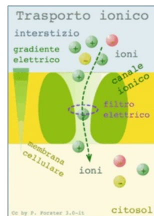
Trasport iontů přes membránu

Vláskové buňky ve vnitřním uchu (Cortiho orgánu) jsou schopny s rozdílným účinkem reagovat na různou zvukovou frekvenci, fungují tedy jako audioreceptory. Jejich membrána obsahuje vysoké množství mechanicky aktivovaných iontových kanálů, které se aktivují postupující zvukovou vlnou. Tímto procesem je umožněn převod zvuku na nervový signál, který se nervovými drahami (n. vestibulocochlearis) prostřednictvím synapsí šíří do centrálního nervového systému ke zpracování a vyhodnocení.