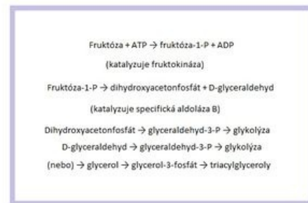
Metabolismus fruktózy v těle