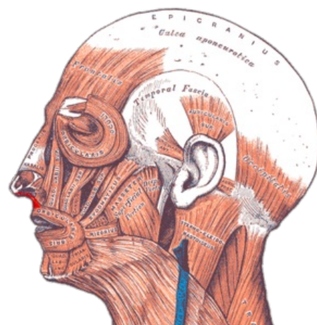
Gray — musculus levator labii superioris alaeque nasi

Úpon kůže v oblasti nosního křídla; laterální okraj horního rtu