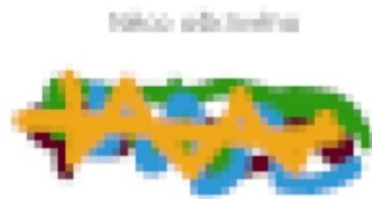
Příklad ošklivého obrázku.