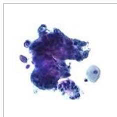
Adenokarcinom: nádorové buňky naplněné intracytoplazmatickými vakuolami s hlenem