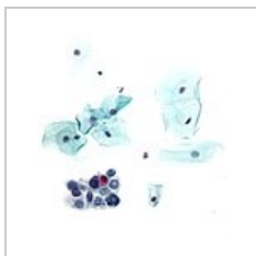
HSIL: menší nádorové buňky se zvětšeným jádrem a nepravidelným chromatinem