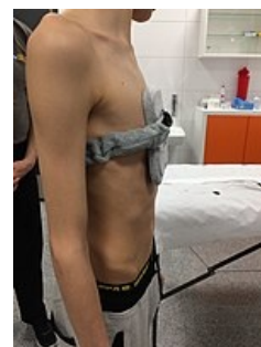
Ortéza určená k léčbě pectus carinatum