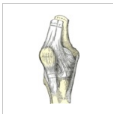
Patella in situ