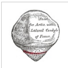
Facies posterior patellae

Při nedokonalé osifikaci patelly může dojít k jejímu rozdělení ve dvě samostatné kosti – patella bipartita .