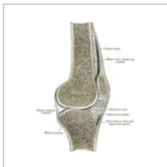
Patella in situ