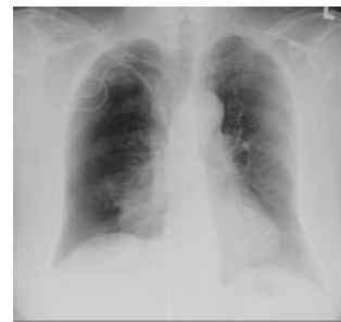
RTG pneumothorax vpravo, iatrogeně po zavedení CŽK