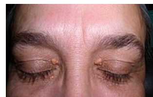
Nažloutlá plošná kožní prominence v oblasti horních očních víček

Fosfolipidy jsou také zvýšeny, zejména u homozygotů. Hyper-LDL-lipoproteinemie je konstantní; apoprotein B je rovněž značně zvýšen; poměr LDL-cholesterol / fosfolipidy je výrazně zvýšen, zatímco poměr HDL-cholesterol / fosfolipidy je snížen.