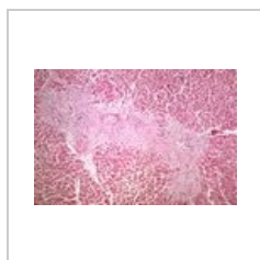
Granulomy a fibróza v oblasti jaterní trias