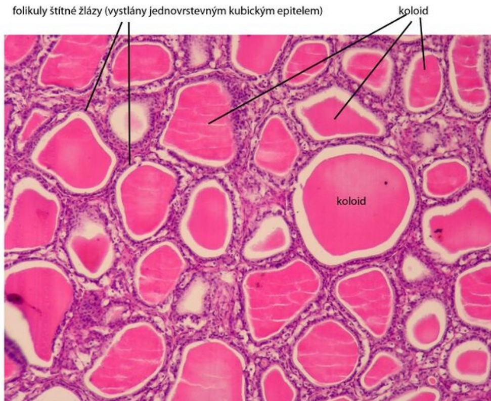
Štítná žláza (glandula thyroidea) - barveno H&E