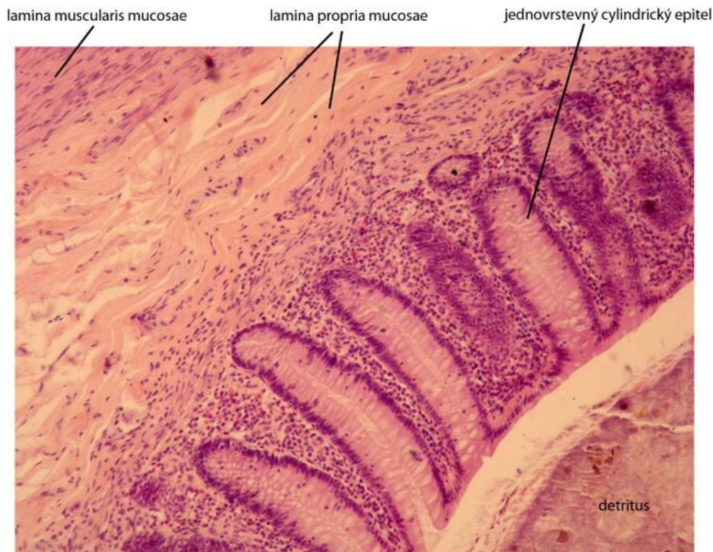
Appendix vermiformis - barveno H&E