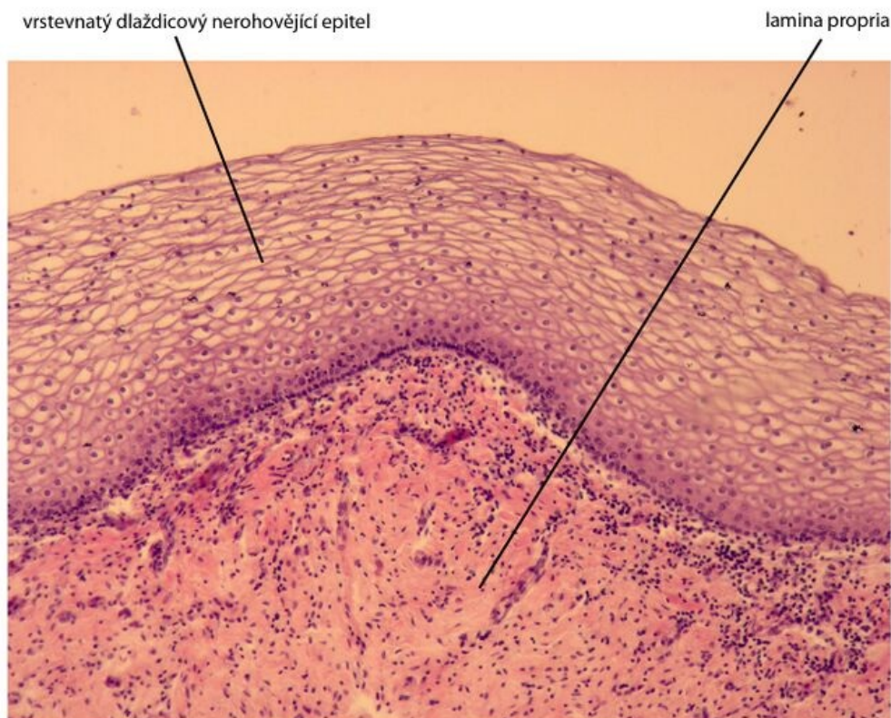
Vagina (pochva) - barveno H&E