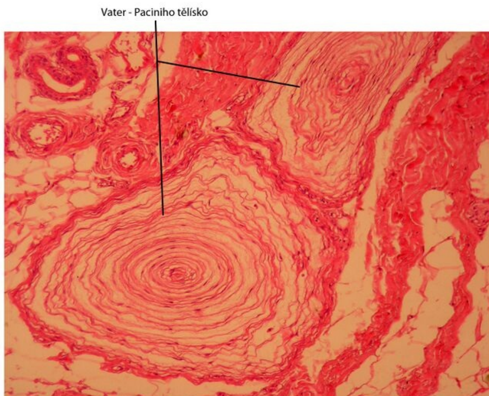
Kůže - Vater - Paciniho tělísko, barveno H&E