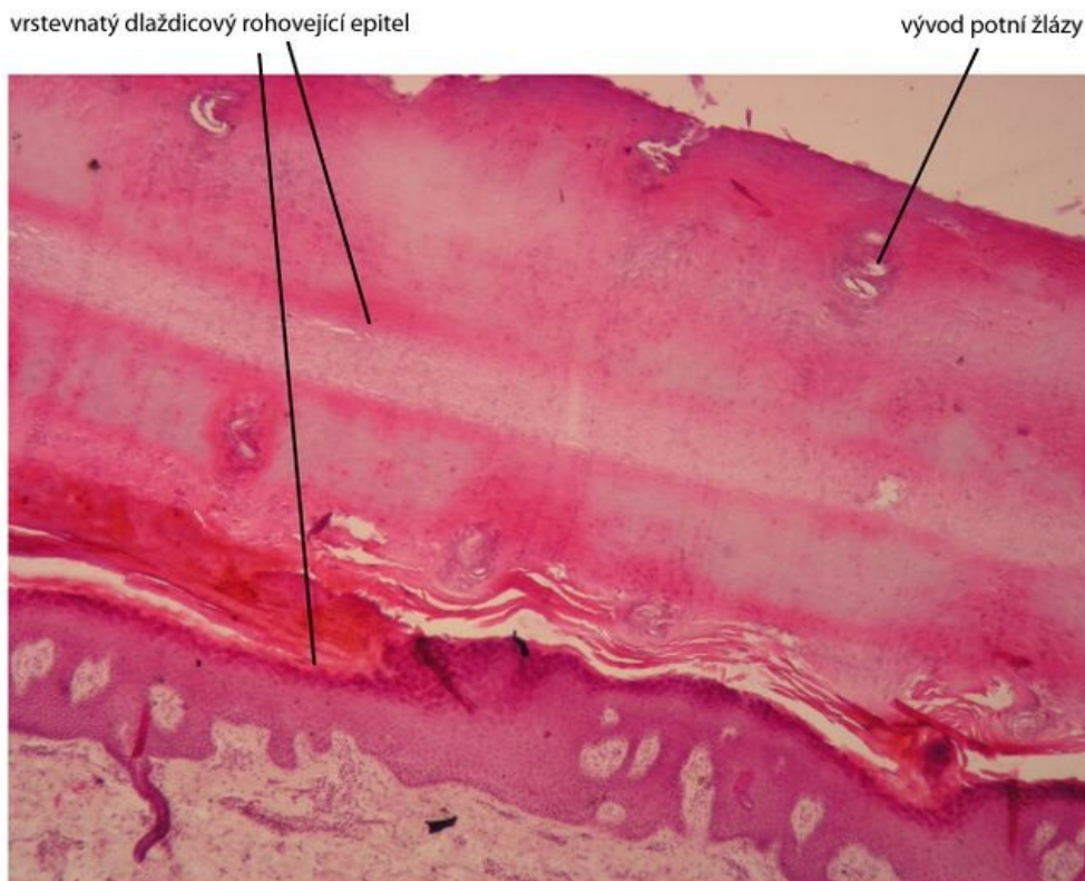
Vrstevnatý dlaždicový rohovějící epitel - kůže silného typu - preparát planta pedis, barveno H&E