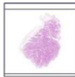
Svalové vřeténko / Muscle spindle: