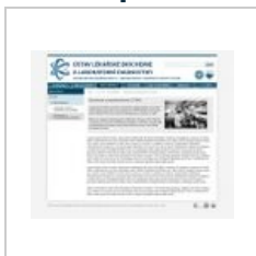
ukázka menu pro učitele