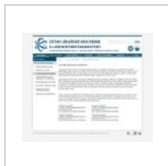
ukázka menu pro studenty