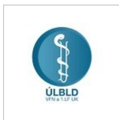
re-design loga s hadem a zkumavkou 1