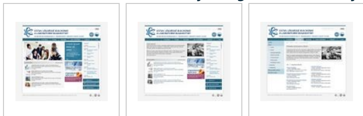
Hlavní strana - barevná