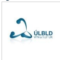
další varianta loga