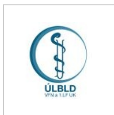
re-design loga s hadem a zkumavkou 2