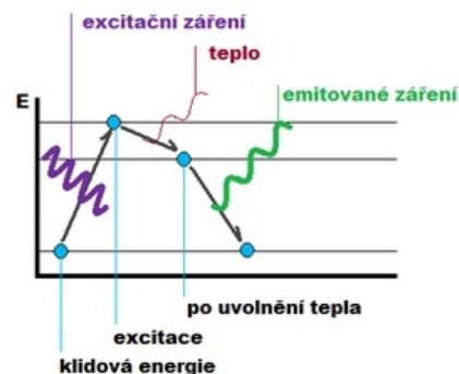
Energetické hladiny elektronu.

Původ luminiscenčního záření je v atomech popřípadě v molekulách látek. Model atomu byl navržen již v roce 1911 anglickým fyzikem Ernestem Rutherfordem. Tento model byl dále upravován a upřesňován dalšími fyziky. Pro pochopení fluorescence je postačující představa modelu atomu dánského fyzika Nielse Bohra, který se domníval, že elektrony obíhají jen po určitých drahách - orbitalech. Každý orbital představuje určitou hladinu energie potřebnou pro udržení elektronu v obalu. Čím je orbital vzdálenější, tím více energie na udržení je potřeba a naopak tím menší energie je potřeba na odtržení elektronu. K vlastní luminiscenci dochází prakticky jen, když se atom nachází ve vybuzeném stavu (excitace). Jedná se o stav, kdy dochází k absorpci energie dopadajícího záření nebo dopadajících elektronů. Energie atomu se následně zvyšuje, jelikož obíhající elektrony přecházejí do vzdálenějších orbitalů. Na základě kvantového modelu atomu nemůže mít atom libovolnou energii a jednotlivé energetické stavy tvoří nespojitou řadu, z čehož vyplývá, že atom musí přijímat energii po kvantech. Vyšší energetické stavy jsou nestabilní a atomy se po určité době vracejí do svého stabilního ustáleného stavu. Časový interval návratu do základního stavu bývá většinou velmi krátký. Přebytečná energie je vyzářena v podobě kvanta zářivé energie - fotonu.