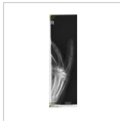
Avulze baze středního clanku