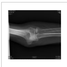
Transepikondylicka fr. AP 1