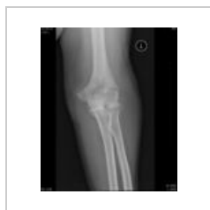
Transepikondylicka fr. AP 2