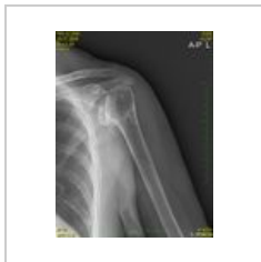
Nekrosa hlavice humeru