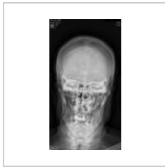
Fraktura mandibuly oboustranne