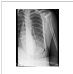
Abrupce proc. cor.