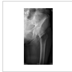
Abrupce velkého chocholiku