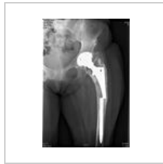
Fraktura femorálního driku TEP