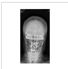
Fraktura mandibuly oboustranne