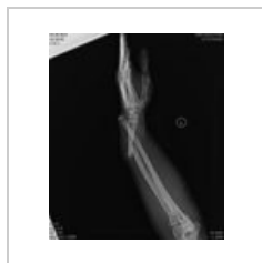
Galeazziho zlomenina bocny