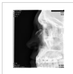
Fraktura nosnich kustek