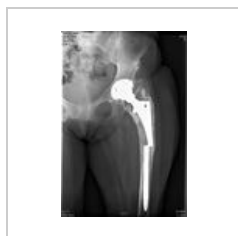
Fraktura femorálního driku TEP