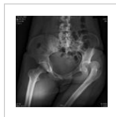
Luxace v kyceľnim kloubu