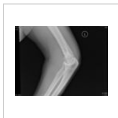
Transepikondylicka fr bocny