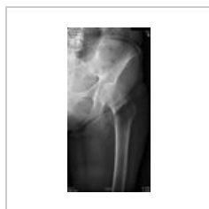
Abrupce velkeho chocholiku