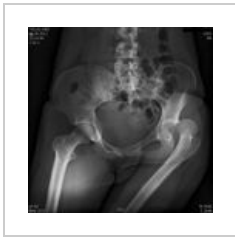
Luxace v kyčelním kloubu