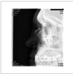
Fraktura nosních kustek