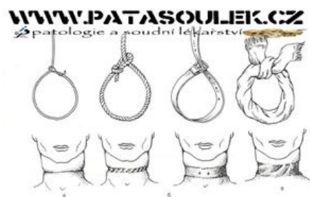
Typ Strangulačních rýh