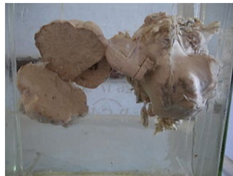
Krukenbergův nádor ovária

Epitelové nádory se šíří zejména implantačně a lymfogenně [2] . Dysgerminomy metastazují zejména lymfogenně , implantačně zřídka [1] .